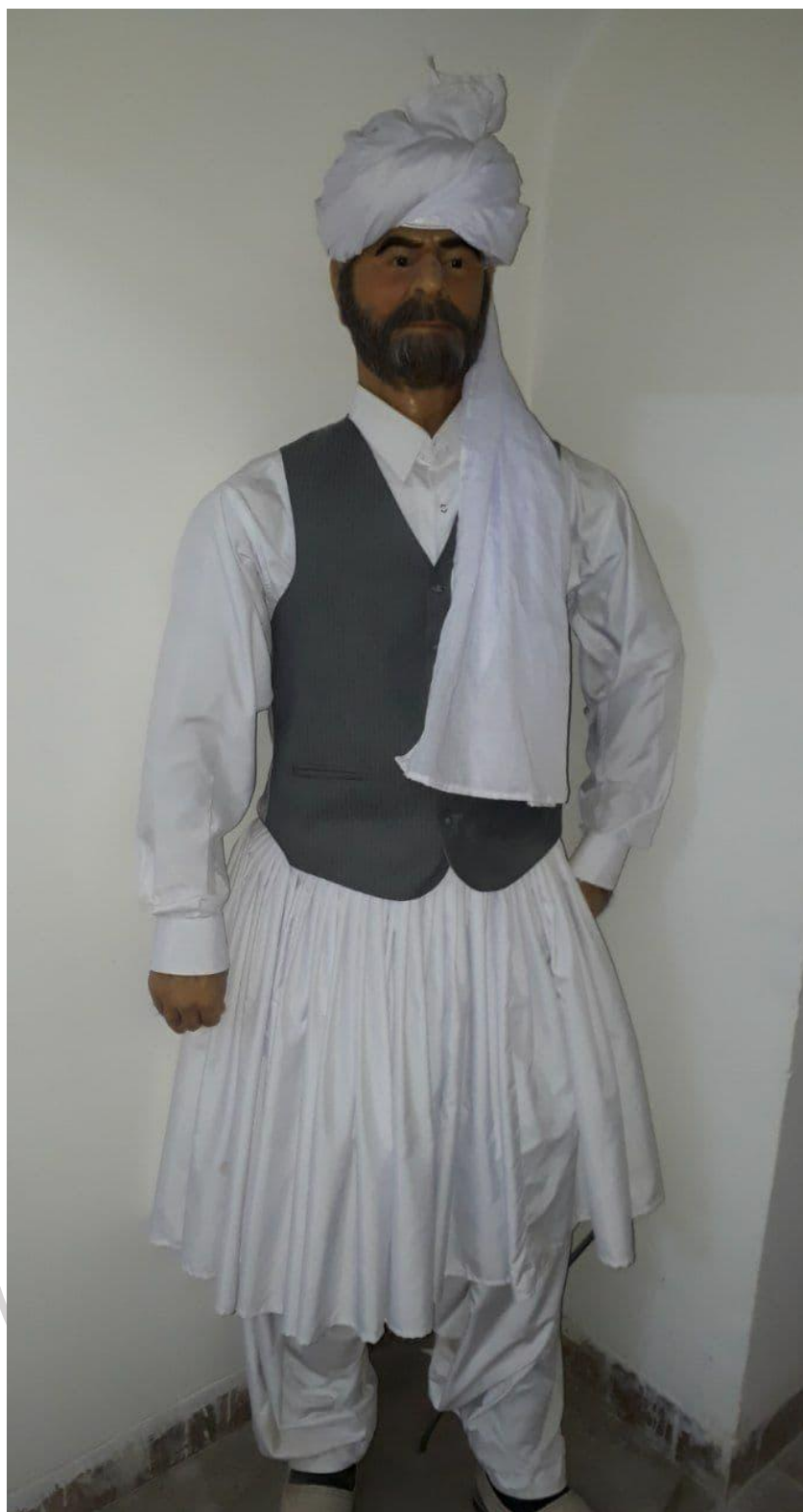
پوشاک مرد سیستانی با پیراهن چل تریز، جلیقه و پوشش سر با لونگته