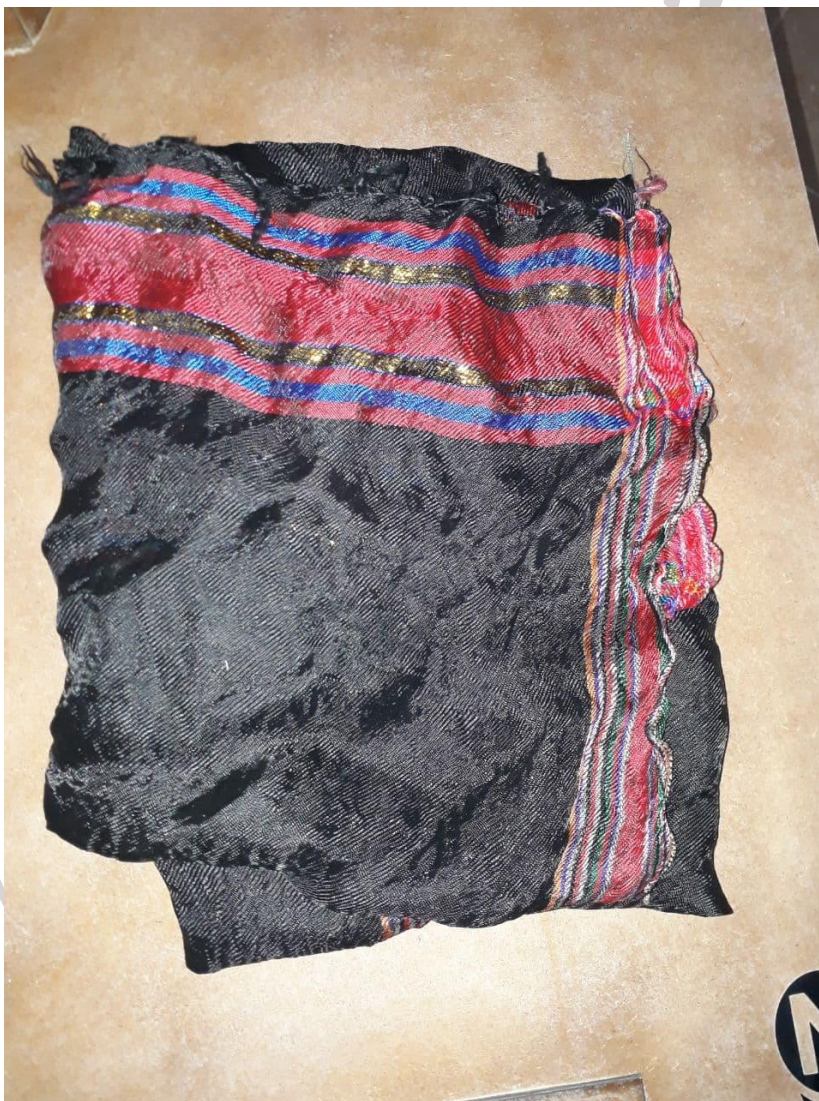
دستمال سر یا لچک بانوان سیستانی

پارچه چهارگوشی به رنگ مشکی است که نوارهای قرمز رنگی در پیرامون آن دارد. بانوان ابتدا دستمال را دو لا کرده و به سه شکل سه گوش روی سر قرار می دهند و سپس دو گوشه آن را پشت سر برده می تابانند و در ناحیه جلو روی پیشانی نیز تاب می دهند و به شکل ضربدر در می آورند و دو گوشه آن را در پشت سر گره می زنند. معمولاً موها به شکل چتر از زیر دستمال نمایان می شود.