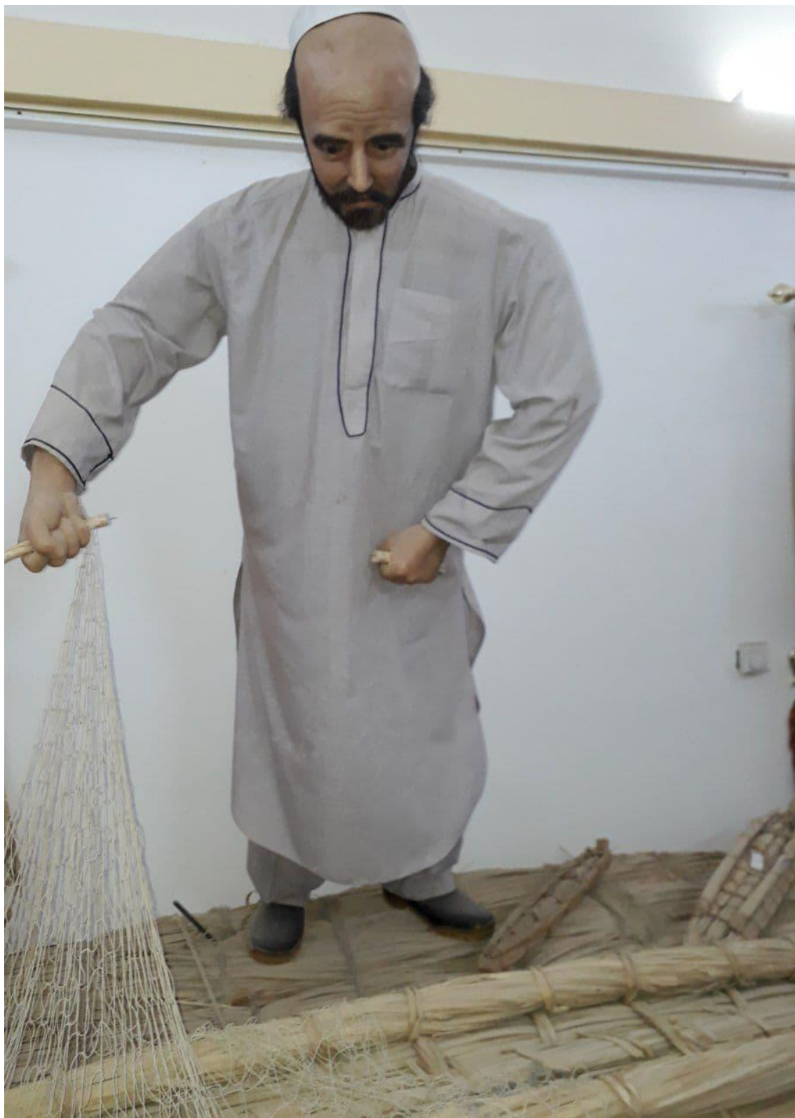
لباس صیادان سیستان