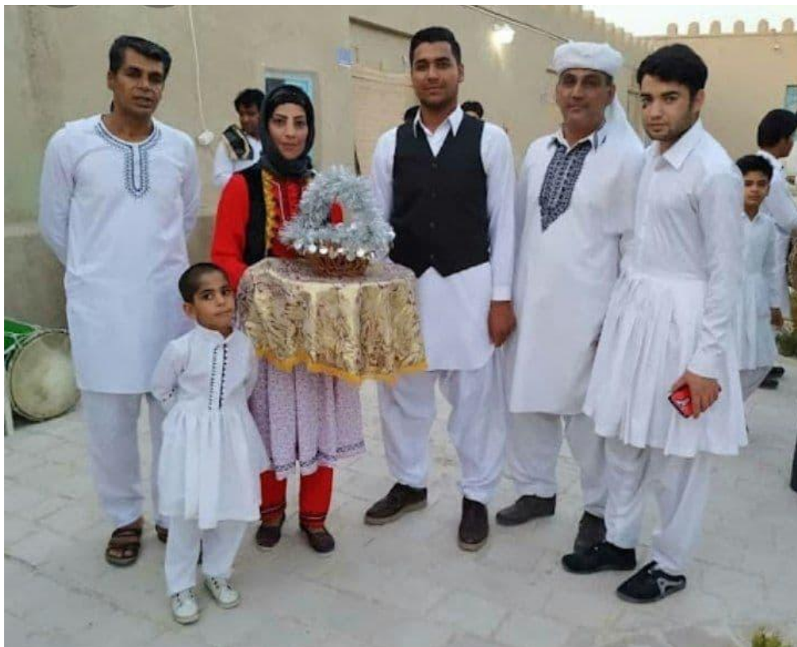
مردان سیستانی با پوشاک مختلف محلی