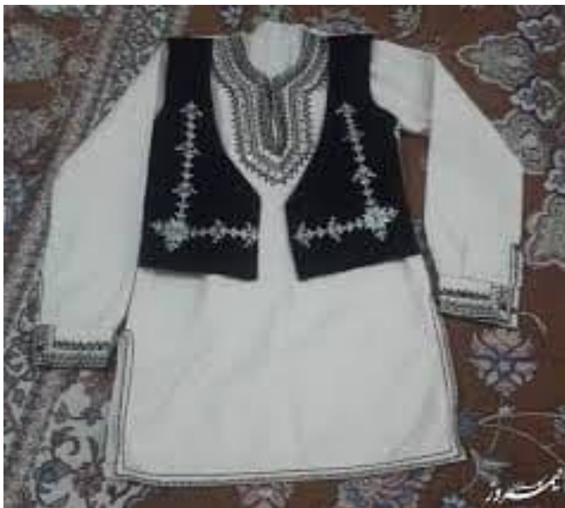
جلیقه خامه دوزی شده، پیراهن سیاه دوزی سیستان