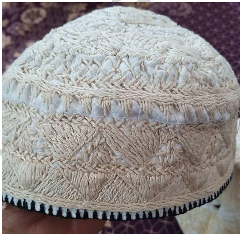
کلاه مردان سیستان

استفاده از کلاه به گونه های مختلف مرسوم است. گاه فقط کلاه بر سر می نهند و زمانی سربندهای دیگر از قبیل: شال، لنگ و یا لونگته: Lon gota می بندند. مردان به هنگام کار به علت عرق کردن و جلوگیری از گرم شدن بدن کلاه را از سر برمی دارند.